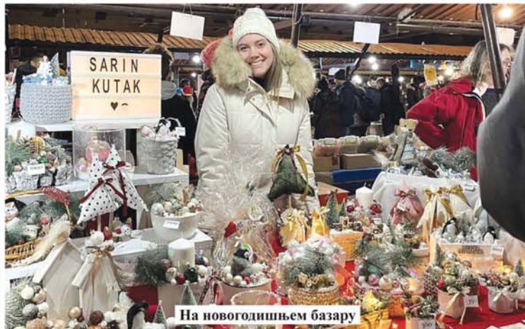
На новогодишњем базару