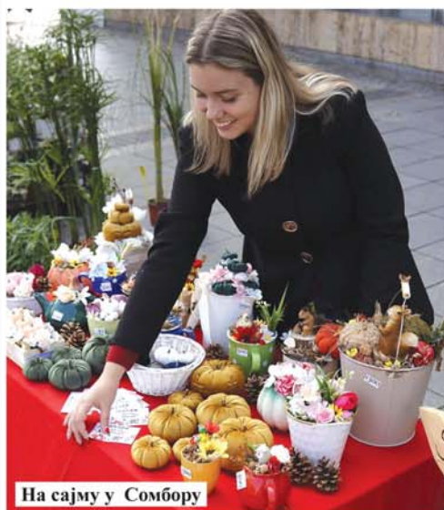
На сајму у Сомбору

- Толико предивних порука сам добила и нових познанстава склопила, и на крају када погледам колико мојих аранжмана краси домове по целој Србији поносна сам на себе. Волела бих једног дана да имам свој кућак где ћу стално моћи да излажем и правим декорације и где ће оне бити доступне свима, и тиме да свој хоби претворим у прави посао који ће ме испуњавати јер сам најсрећнија у својој малој радионици. Надам се да ће неко након што прочита овај текст скупити храбрости да започне свој мали бизнис. Сваки почетак је јако тежак, биће успона и падова и моментата за одустајање али не треба никад одустати и волела бих да се свако ко имало размишља о томе одважи на тај први корак и почне да испуњава своје жеље и снове. Ја сам само у најлуђим мислима замисљала како пакујем више од 50 аранжмана и идем у други град да их излажем а онда да се кући враћам са празним кутијама - поручила је ова млада креативна девојка.