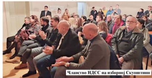
Чланство НДСС на изборној Скупштини