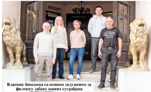
Власник биоскопа са екипом задуженом за филмску забаву наших суграђана