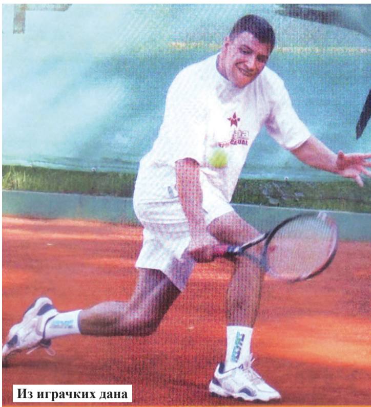
Из играчких дана